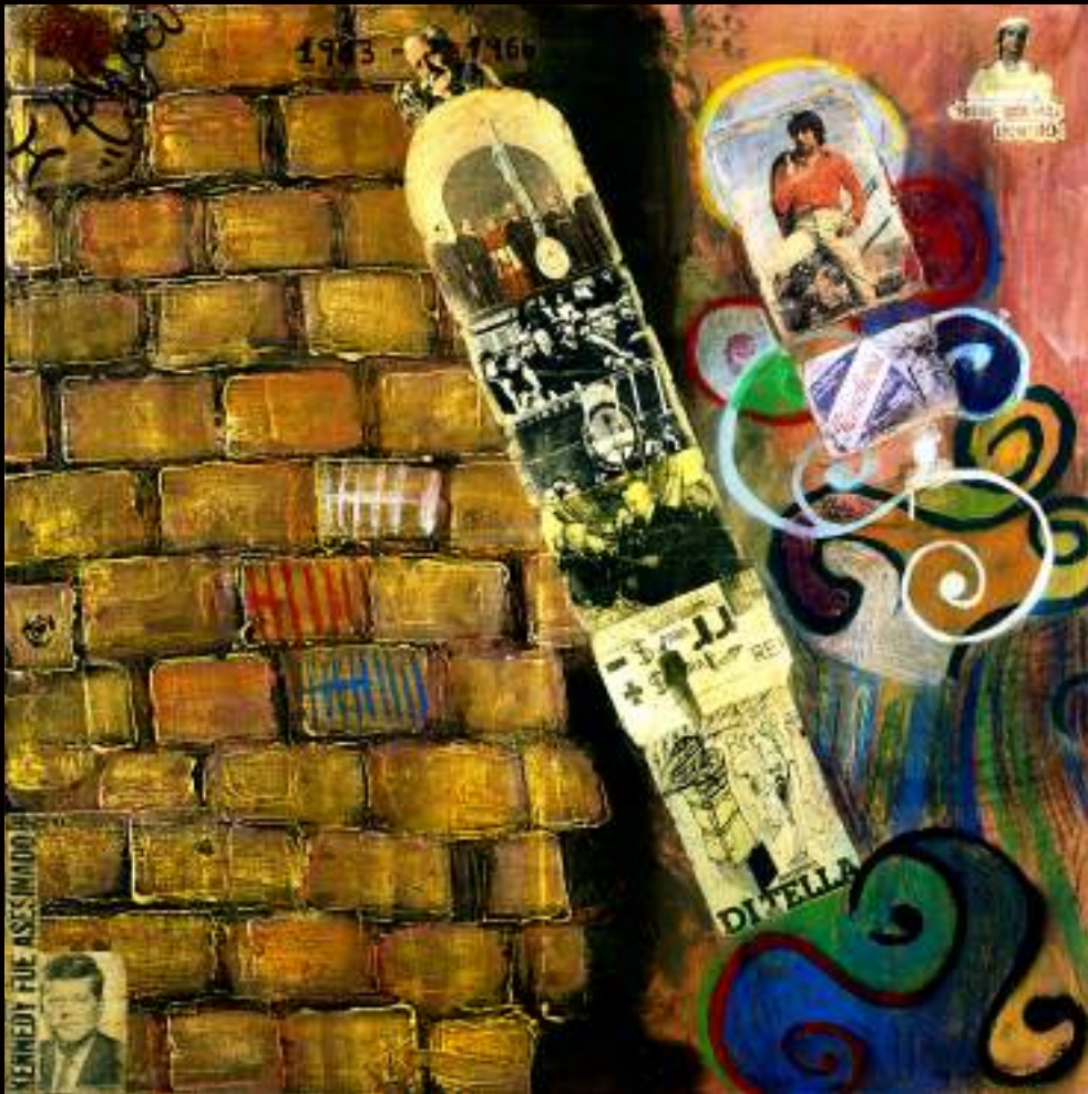
1963-1966 Mixed media 39 x 39 inches