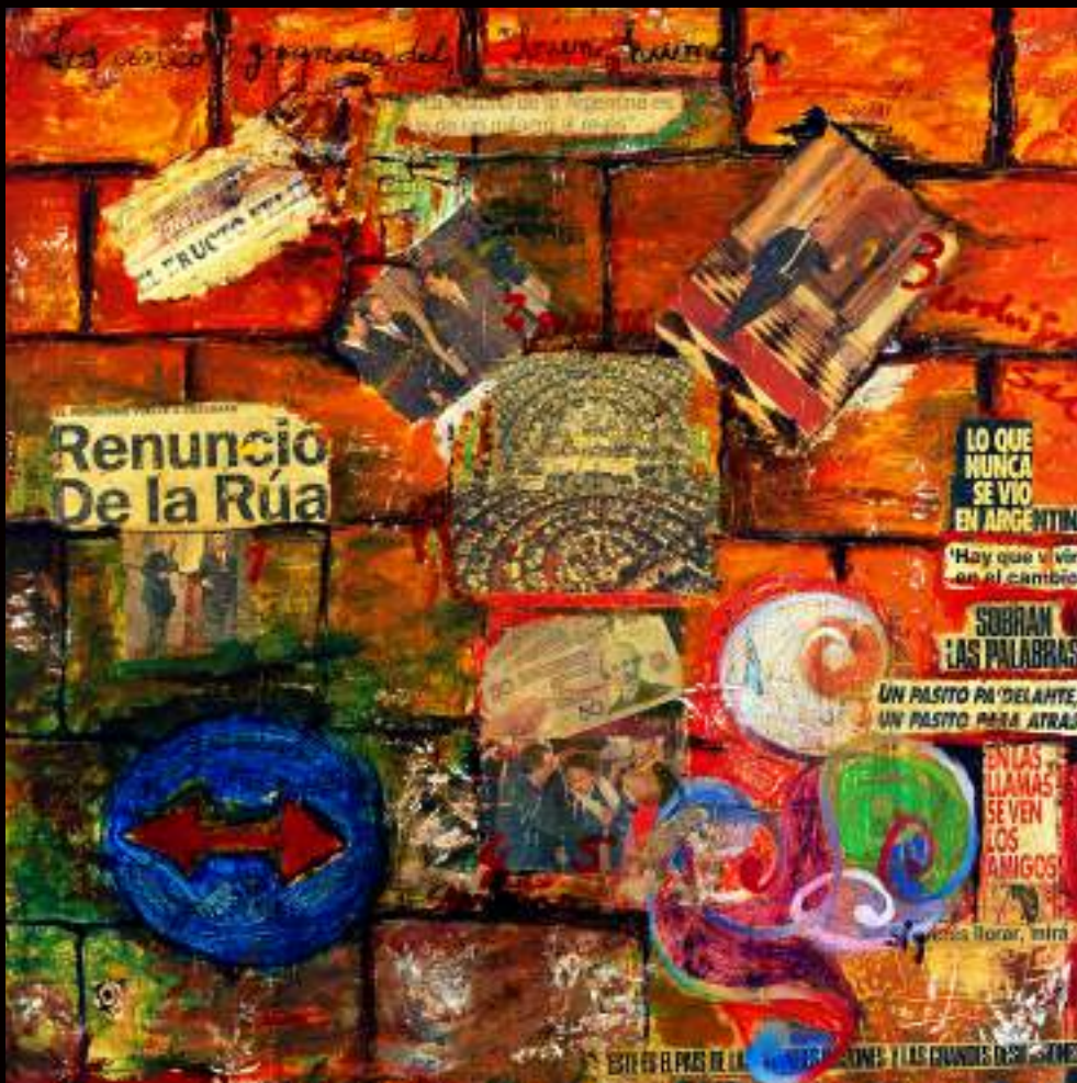
5 comentarios Mixed media 39 x 39 inches