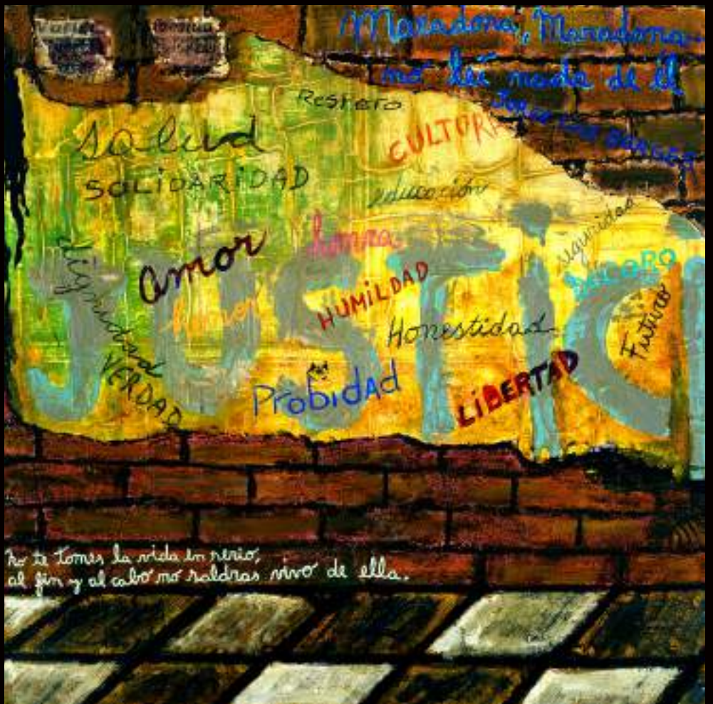
El deseo de todos Mixed media 39 x 39 inches