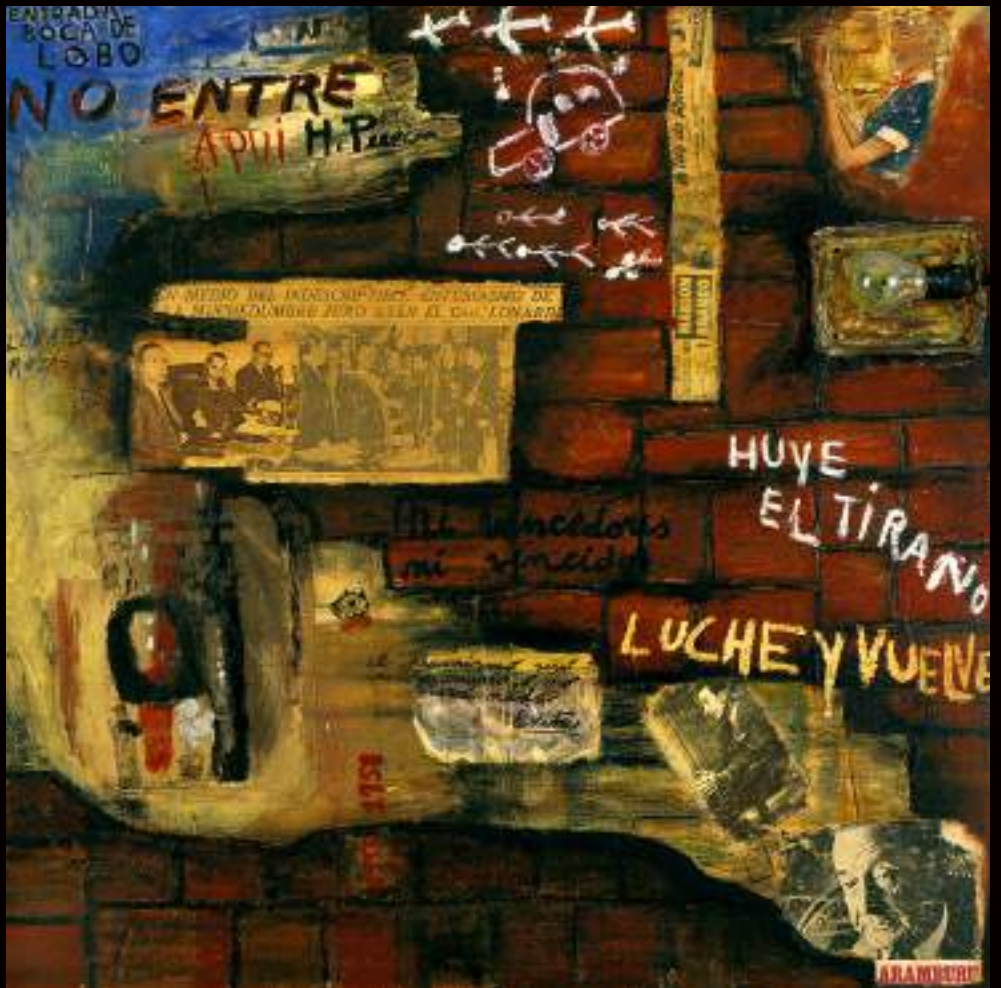
1955-1958 Mixed media 39 x 39 inches