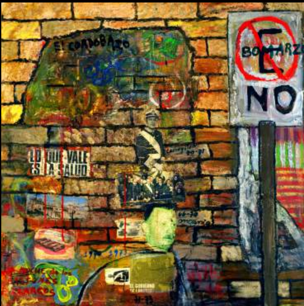
1966-1973 Mixed media 39 x 39 inches