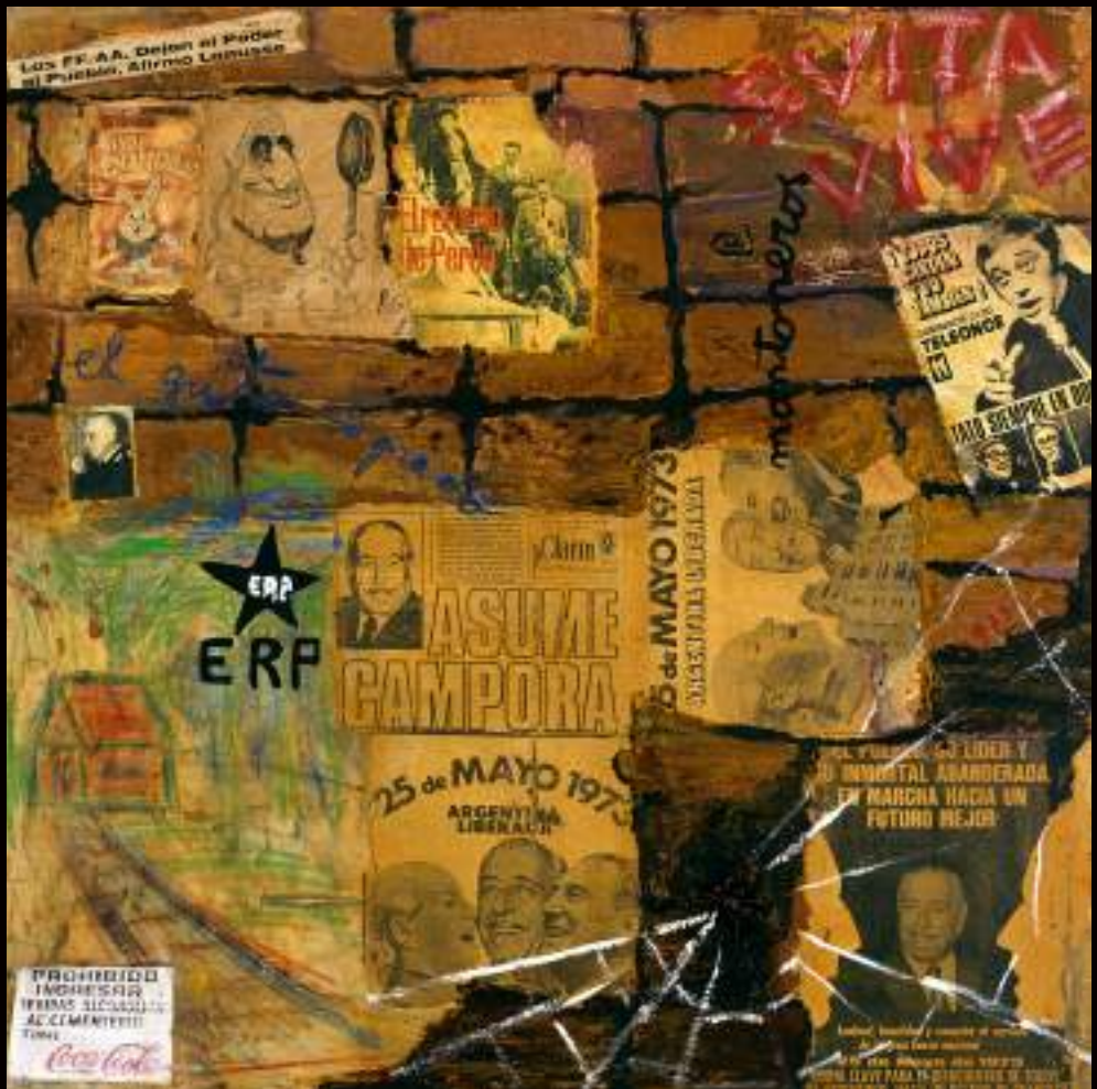
1973 Mixed media 39 x 39 inches