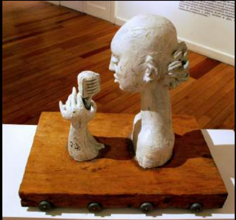
Eva Perón | Escultura cerámica sobre madera y ruedas | 18 x 25 x 10 inches, 1990 | Colección Privada - Private Collection