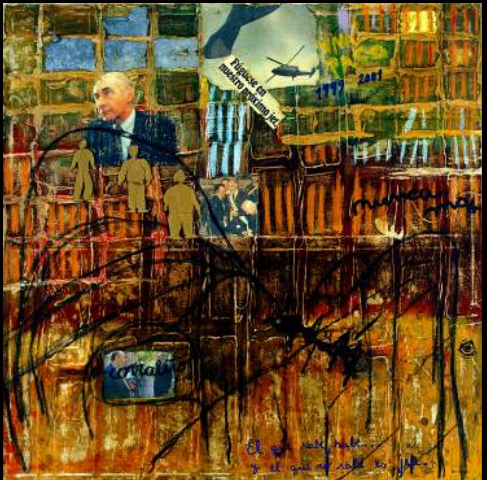
1999-2001 Mixed media 39 x 39 inches