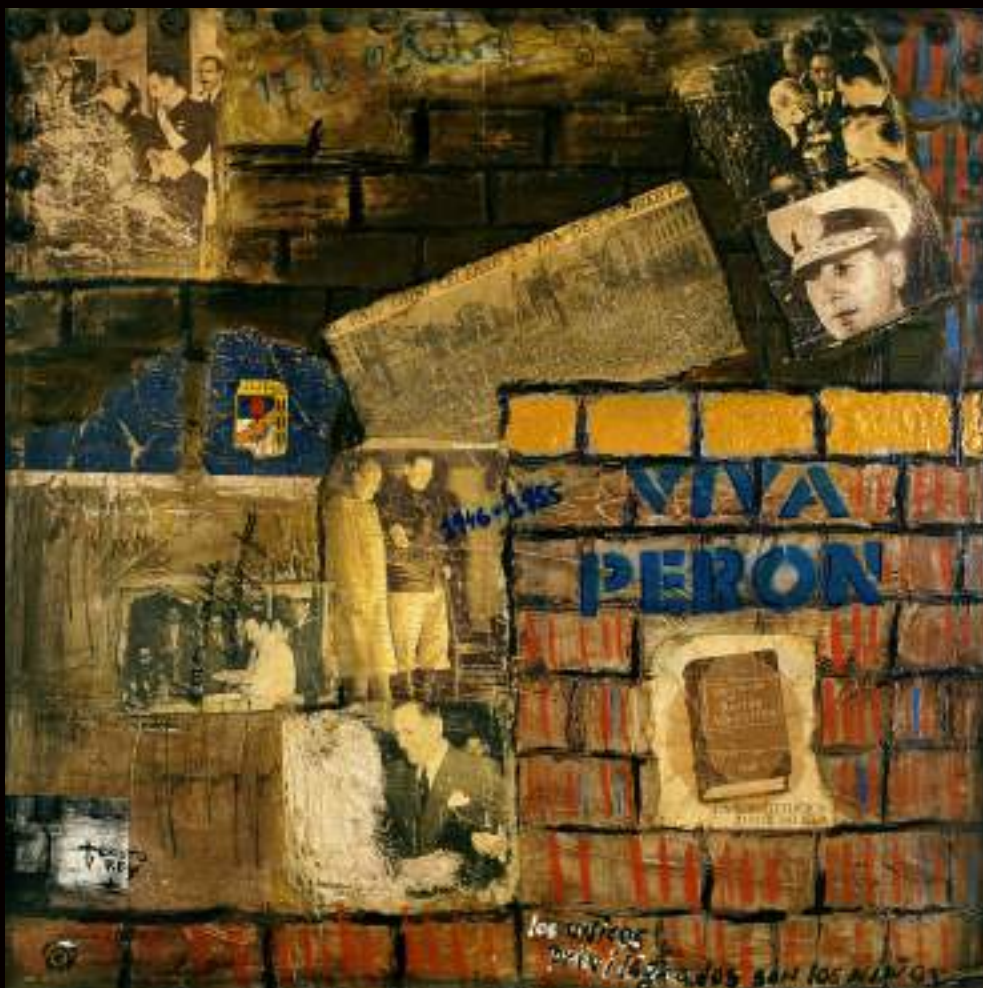
1946-1955 Mixed media 39 x 39 inches