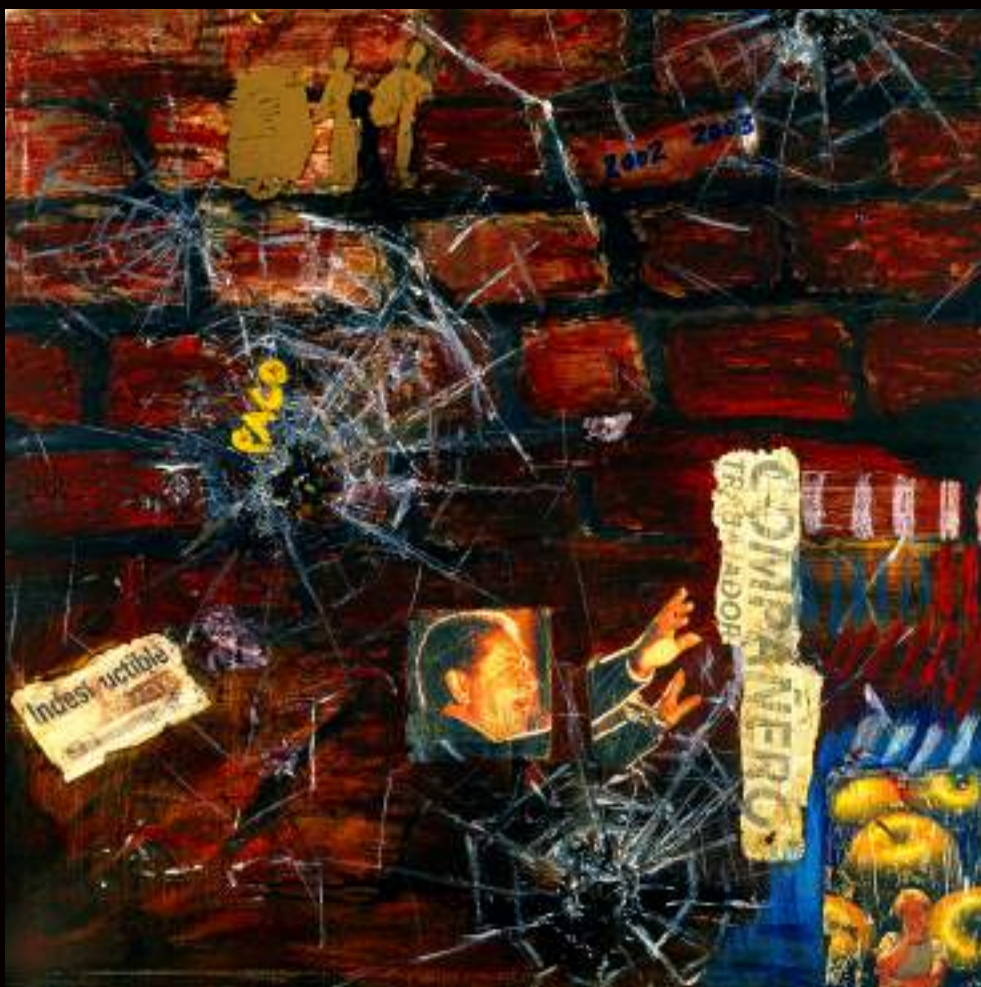
2002-2003 Mixed media 39 x 39 inches