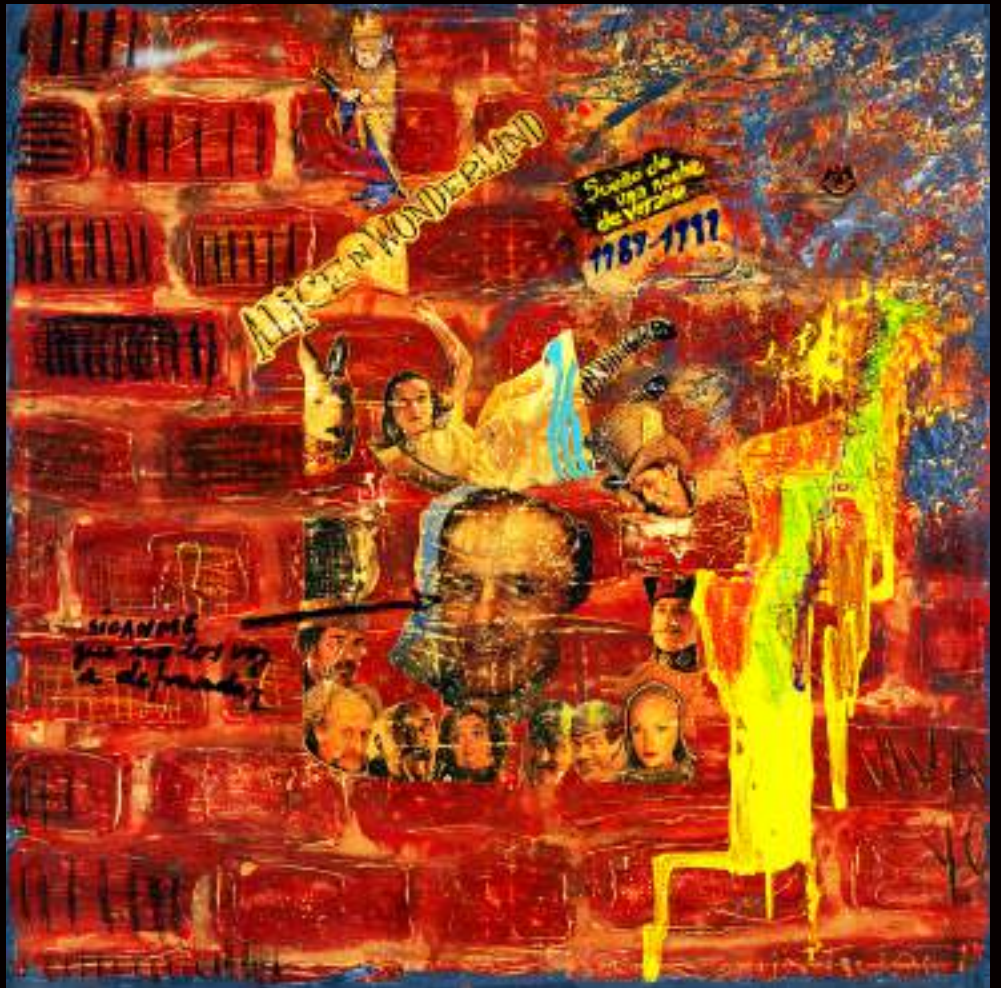
1989-1999 Mixed media 39 x 39 inches