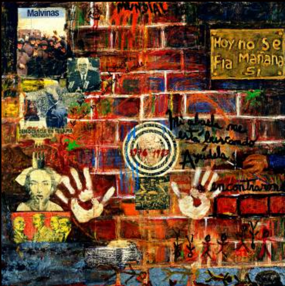
1976-1983 Mixed media 39 x 39 inches