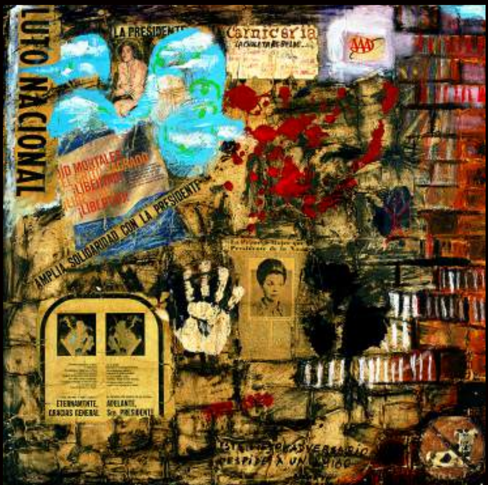
1973-1976 Mixed media 39 x 39 inches