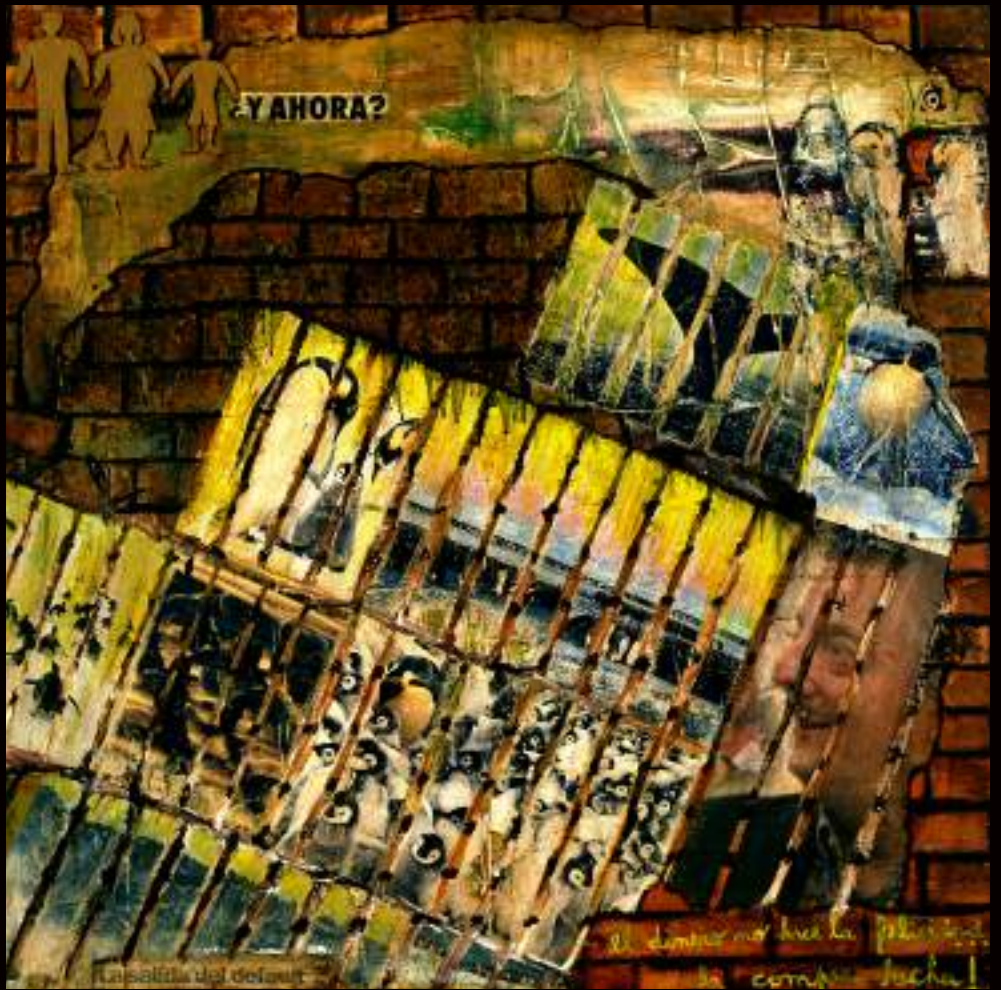
Presente Mixed media 39 x 39 inches