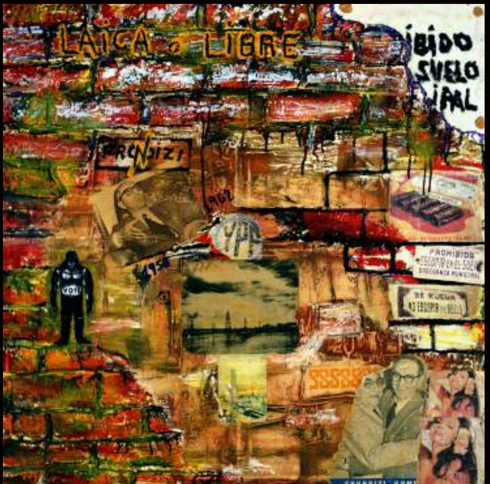
1958-1962 Mixed media 39 x 39 inches