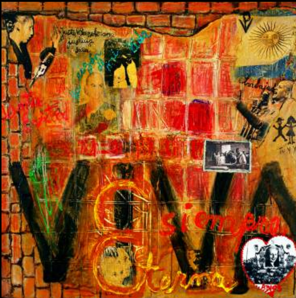
Inolvidable Mixed media 39 x 39 inches